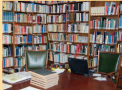
BIBLIOTEKA I ARCHIWUM

Archiwum HAUS SCHLESISIEN obok pisemnych przekazów dotyczących historii, kultury i życia codziennego na Śląsku zawiera bogate zbiory fotografii, przezroczy, grafik oraz ok. 25 000 widokówek. Całość zasobów uzupełniają różne media audiowizualne.