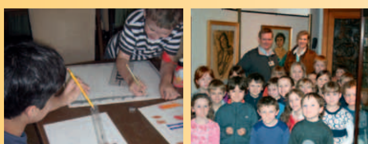
FÜR KINDER UND JUGENDLICHE