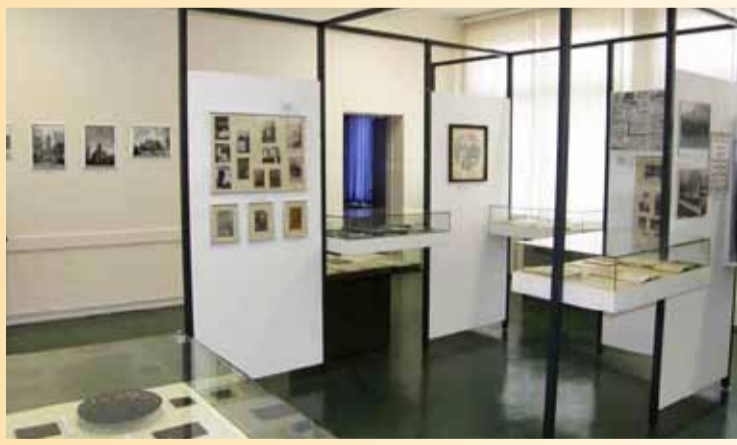
PROJEKT „ZBIORY REGIONALNE“

Zasadniczą ideą projektu jest zaoferowanie osobom prowadzącym regionalne izby pamięci wsparcia oraz udzielenie im rad, w jaki sposób zgodnie z zasadami konserwatorskimi mają zachowywać i pielęgnować swoje zbiory. Na miejscu może być okazana konkretna pomoc przy porządkowaniu, archiwizowaniu i inwentaryzowaniu. Pomoc może dotyczyć także całkiem zwyczajnych problemów, jak odpowiednio obchodzenie się z historycznymi dokumentami lub pielęgnowanie mało odpornych na zniszczenie eksponatów. W razie potrzeby HAUS SCHLESIEN gotów jest przejąć zbiory.