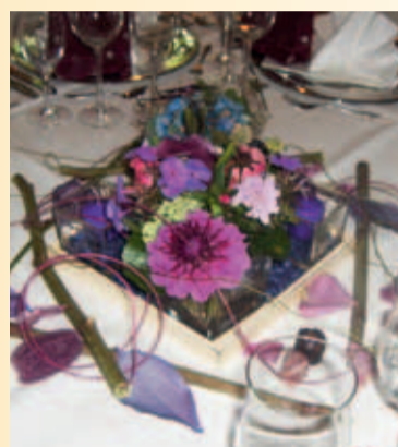
RESTAURACJA I HOTEL