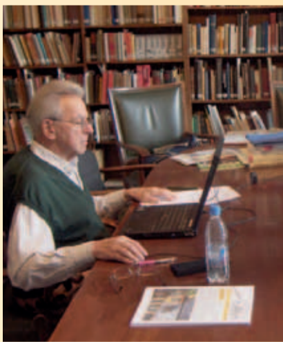
BIBLIOTHEK UND ARCHIV

Das Archiv von HAUS SCHLESISIEN beherbergt neben schriftlichen Überlieferungen zu Geschichte, Kultur und Alltagsleben in Schlesien ein umfangreiches Bildarchiv, das Fotografien, Dias und Graphiken sowie ca. 25.000 Ansichtspostkarten beinhaltet. Hinzu kommen unterschiedliche audiovisuelle Medien.