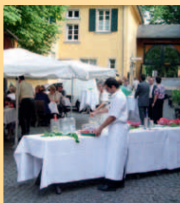
GASTRONOMIE UND LOGIS