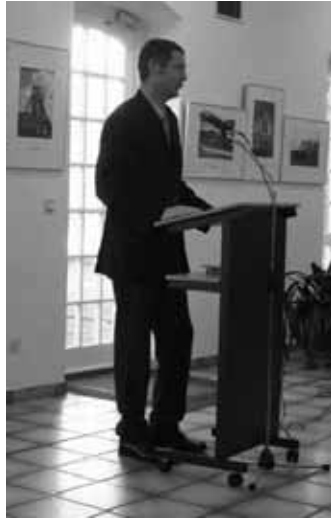
Bürgermeister Peter Wirtz