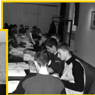
Konzentriertes Arbeiten während des Seminars