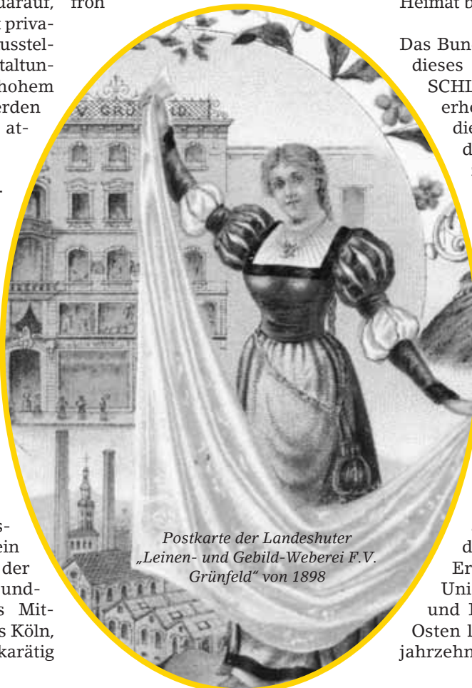
Postkarte der Landeshuter „Leinen- und Gebild-Weberei F.V. Grünfeld“ von 1898

Das Thema „ Europa “ gewinnt zunehmend an Interesse und macht junge Leute neugierig. Nicht nur der Umstand, dass augenblicklich die deutsche Bundeskanzlerin die europäische Ratspräsidentschaft innehat, sondern auch die Tatsache, dass in diesem Jahr erfolgte erneute Erweiterung der Europäischen Union um die Staaten Bulgarien und Rumänien den Blick in den Osten lenkt, sorgen dafür, dass die jahrzehntelang in den Köpfen der