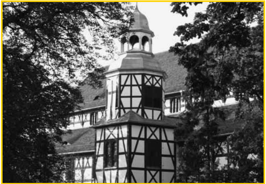
Die 350 Jahre alte Friedenskirche in Jauer

Der Glockenguss hatte in Schlesien seit dem Mittelalter bereits eine lange Tra-