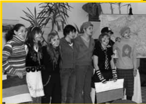
Lebhaftes Präsentation der erarbeiteten Ergebnisse aus den Workshops