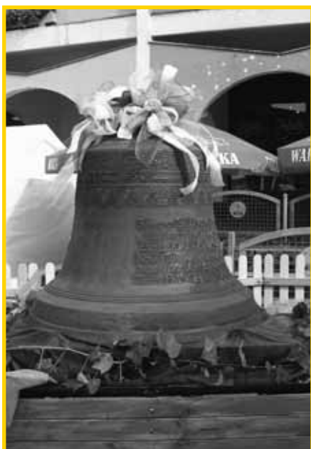
Instand gesetzt für die nächsten 300 Jahre

Nun seien die Glocken der Friedenskirche in Jauer noch einmal im Einzelnen vorgestellt (s.o.). Die Angaben über Durchmesser, Gewichte und Teiltöne entstammen dem Abnahmeprotokoll nach erfolgter Schweißung im Glockenschweißwerk Thomas Lachenmeyer in Nördlingen vom 03.08.2005. Die Abnahme erfolgte am 30.07.2005 durch Herrn Blaschke,