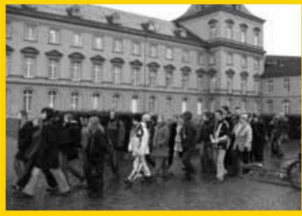
Zum Studium ins Rheinland? Ein Besuch an der Rheinischen Friedrich- Wilhelm-Universität in Bonn